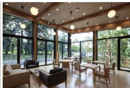
(コミュニティカフェ)