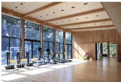
(フィットネススタジオ)