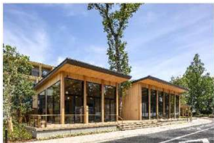
(木造フィットネス・カフェ棟)